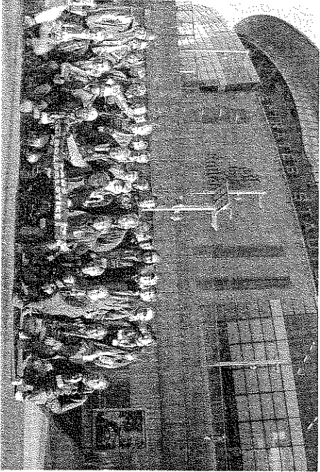
Fotbaloví příznivci Slavie Praha z Rožďalovic navštívili amsterodamský stadion (snímek vlevo) a také stánek londýnského Arsenalu.